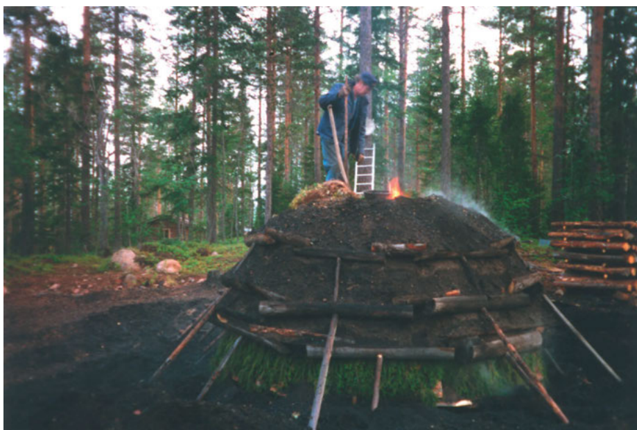
FIGUR 6: Kolmilan i kojbyn är en av sommarens höjdpunkter.

I byn finns tre byggnader som kan sägas utgöra centrala byggnader, två som används kollektivt, den nedlagda skolan som byalaget har köpt samt Folkets hus. Den tredje byggnaden är den centralt placerade Oppigården, ett gammalt stamhemman där flera av byns släkter bott. Det finns också två platser av betydelse utanför byn. Den ena är kojbyn , en plats som är öppen för turister men också fungerar för fester av olika slag, den andra är vallen (Öjungsvallen), den gamla fåbodvallen där byns stamhemman har sommarhus, och vilken inte är tillgänglig för andra än bybor. 13 Kojbyn ligger på väg in mot byn och de flesta besökarna åker inte in den sista biten till byn. Vallen ligger på motsatt sida, bort från byn mot storskogen och för att hitta dit måste man passera byn och åka in på enskild väg. Både kojbyn och vallen kan tolkas som en sorts helgade platser. 14 Båda ligger utanför