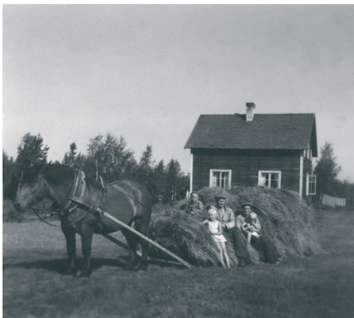
FIGUR 2: Höbärgning. Fotot taget på 1950-talet.

Frågorna kan kanske få sina svar genom en analys av befolkningsstrukturen, dvs. alla som finns i byn, även de som bara är där tillfälligt. Det handlar då om individer som är knutna till olika sfärer med olika avstånd till de ekonomiska tillgångar och centrala värden som finns i byns kärna. Kontinuitet eller förändringsbenägenhet kan måhända förklaras genom det sociala mönstret kopplat till symboliskt och ekonomiskt kapital. Mot bakgrund av de diskussioner som förts om "socialt och kulturellt kapital" och deras betydelse generellt för utveckling och kontinuitet vill jag gå ett steg vidare och visa vilka relationer och föreställningar som utgör grunden i en bygemenskap och i sin tur är viktiga