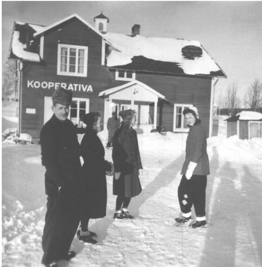
FIGUR 4: (t v) Affärsbyggnaden inrymde under 40 år Kooperativa. "Torget" framför var byns samlingsplats.