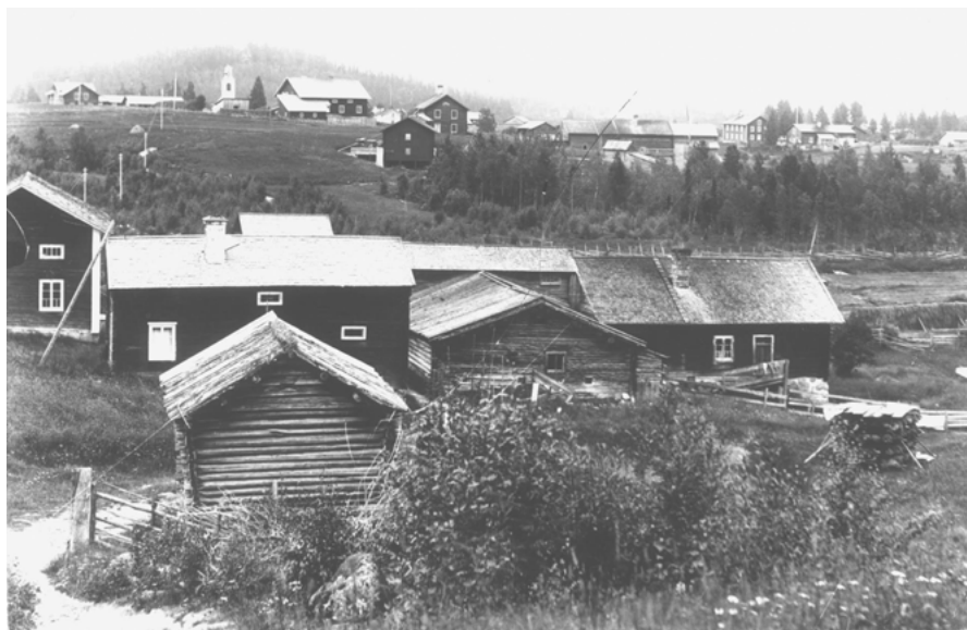
FIGUR 1: Gammal vy över Ängersjö. I förgrunden stambemmanet Åsen, där endast ett hus återstår idag.