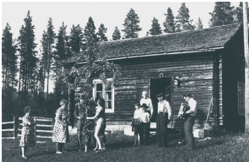
FIGUR 3: Midsommarfirande vid gammelstugan på Svea i Ängersjö på tidigt 1970-tal.

för byns fortbestånd och vilka som har betydelse för nydaning.