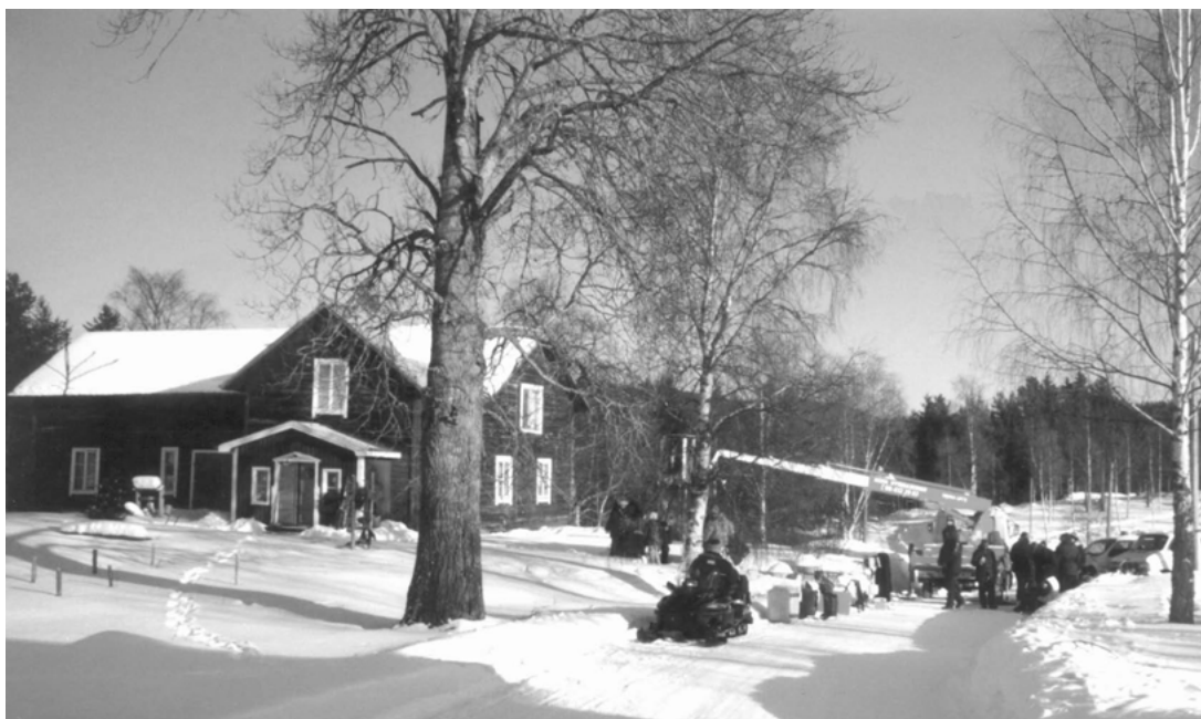
FIGUR 13: Under TV:s filminspelning användes många av husens exteriörer. Här stambemmanet Turgårn.

Under mitt fältarbete inträffade ytterligare en större händelse som påverkade byn. Vintern 2001 spelades tv:s årliga Julkalender in här. 35 Det var återigen via kontakter i skuggbyn, genom att inspelningsledaren fick ett förslag från centralorten att ta sig en titt på byn, som projektet kom till stånd. 36 Det innebar att byborna än en gång måste förhålla sig till en påverkan utifrån precis som med forskningsprojektet. Filmfolk och kända skådespelare invaderade byn under ett par kalla vintermånader och byns mest centrala byggnader förvandlades från tomma hus och nedlagd affär till en levande miljö igen. Tomma hus, som av byborna uppfattas som ett negativt vändes plötsligt till något positivt. Även i samband med detta fanns möjligheter till inkomster för byn och de enskilda hushållen och, vilket också var tilltalande, möjligheten att själva få medverka som statister i produktionen. Det var främst företrädarna för Folkets Hus-föreningen som förde förhandlingar med filmprojektet. Projektet hyrde hela undervåningen på Folkets Hus. Det fördes även förhandlingar om boende och mat, men valet föll på hotellet i centralorten i stäl-