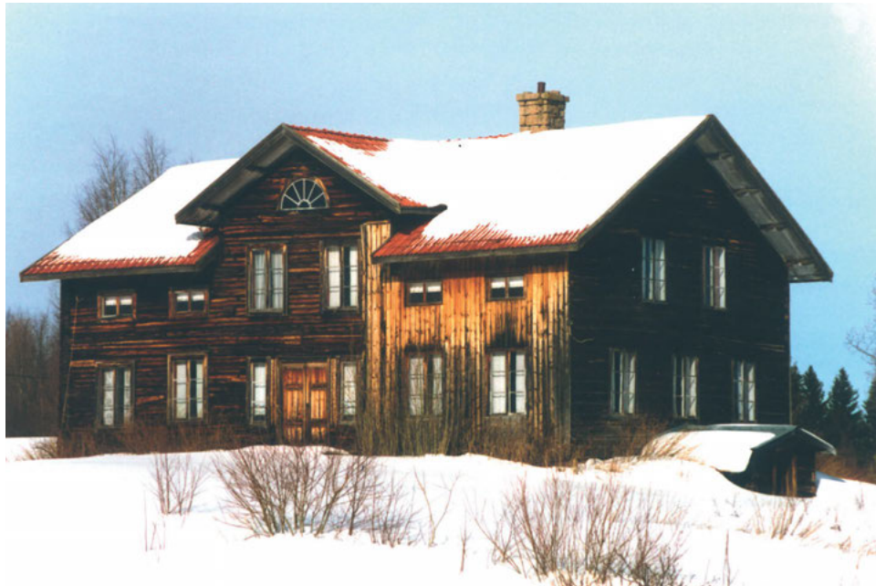
FIGUR 7: Stambemmanet Oppigården.