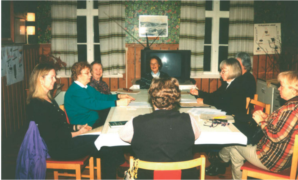
FIGUR 11: Byns kvinnocirkel församlad i den gamla skolbyggnaden.

dessa båda grupperingar som har pågått under lång tid. Enligt byborna har denna konflikt funnits länge men det är svårt att få en förklaring till rivaliteten. De interna förklaringsmodellerna ligger både på det individuella planet och refererar till släktskap