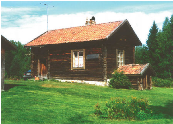
FIGUR 8: Svevallen, en av fåbodarna på Öjingsvallen.

själva byn och är del av det större rummet som utgör Ängersjös omgivning och båda har rituella och återkommande inslag, som årsfester, midsommarfirande och arrangemang kring älgjakten. Båda platserna associeras med myter och historia. Att vallen hålls undan för turister och utomstående pekar mot att den kanske ännu mer kan tolkas som betydelsefull och helgad plats. Den uppfyller kriterierna för mer internt hållna evenemang med en snävare krets av släktingar och vänner än de evenemang som hålls i kojbyn med hemvändare, sommargäster och turister. 15 Samtliga hus som